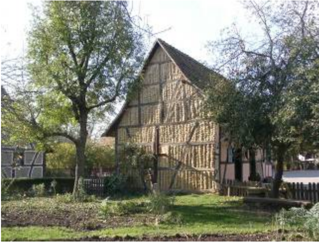
Figure 7. La scénographie de l'écumusee d'Alsace stabilise l'état de Gommersdorf en sa phase de transformation dans les décennies 1970-1980.