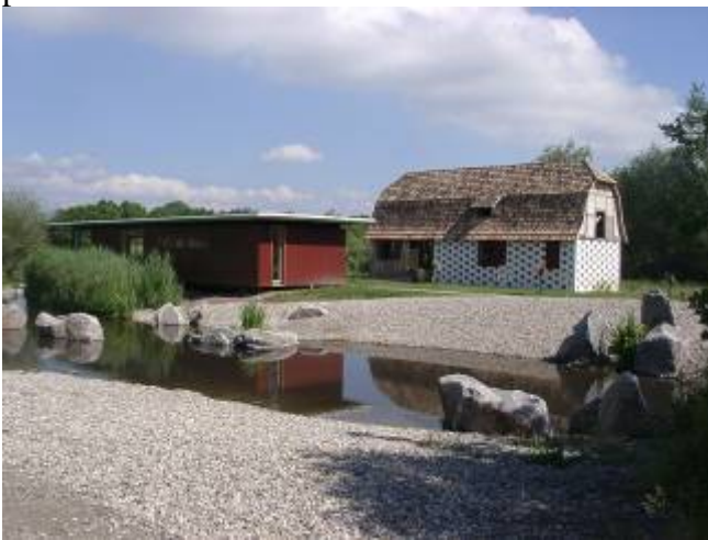
Figure 8. La maison comme objet anthropologique à l'écumusee d'Alsace. La scénographie indique les transformations d'une maison paysanne au fil de son occupation depuis le XVIIIe s. et propose sa confrontation avec les idées sur l'habitat au XXe s.