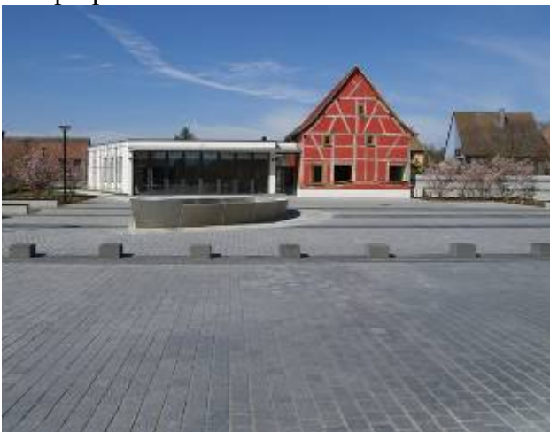
Figure 9. Un aménagement contemporain (2007) d'un centre village en Alsace. La nouvelle mairie intègre une maison paysanne démontée dans le même village. Avec la fontaine en béton en forme de barque, évoquant la pêche activité ancienne du village, cet ensemble –non sans qualité architecturale- est représentatif de l' « éradication de l'invisible ».