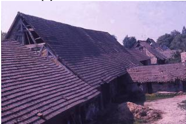
Figure 2. Gommersdorf (Haut-Rhin), les granges désaffectées (1972)