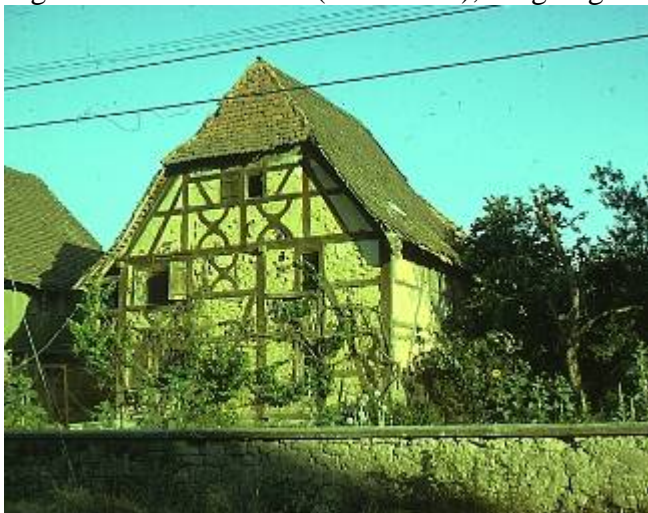
Figure 3 : un « tas de boue » à Gommersdorf (1972) qui, contrairement aux autres maisons du village restaurées in situ par les chantiers de bénévoles et les habitants, sera in fine (1988) démontée et transportée à l'écomusée d'Alsace.