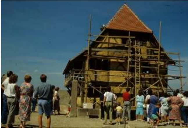
Figure 4. La maison de Gommersdorf en cours de reconstruction à l'écomusée d'Alsace (1988)