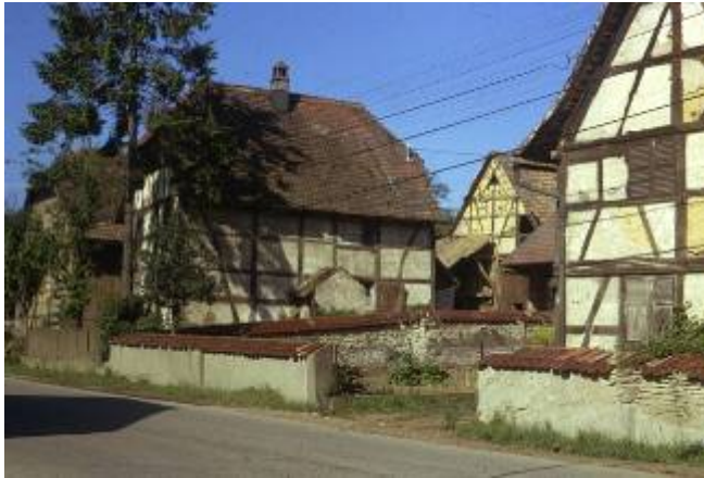
Figure 1. Gommersdorf (Haut-Rhin), le village berceau des chantiers de l'association « Maisons paysannes d'Alsace », maisons inhabitées côté rue (1972)