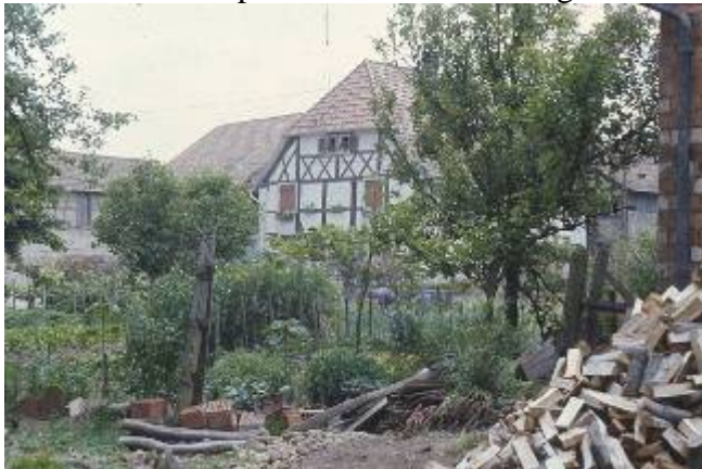
Figure 6. Le cœur de Gommersdorf (1972) ultime repli du sauvage dans le territoire